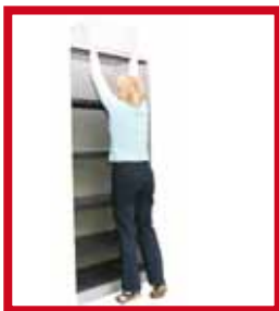
Hoogtes boven het hoofd: geen lasten opbergen op deze hoogtes