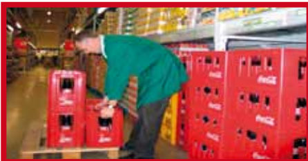
Frequent tillen van lasten