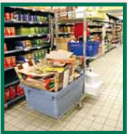
Een bak voor verpakkingskarton op de aanvulker beperkt het aantal verplaatsingen