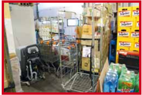
Een slordige werkplek verhoogt het risico op een val