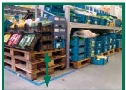
Het op hoogte plaatsen van kratten met winkelwaren op palletten is niet alleen voor de klanten makkelijker maar is ook comfortabeler tijdens het aanvullen