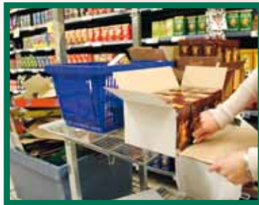
Met behulp van een werkvlak, aangebracht op hoogte op de kar voor het aanvullen van de winkelwaren, gebeurt de voorbereiding makkelijker