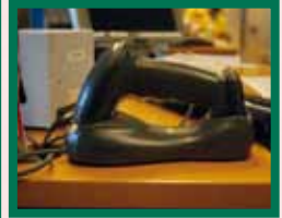
Een draadloze laserscanner beperkt de manipulatie van lasten tijdens het scannen. Zeker voor zware of grote lasten is dat van belang