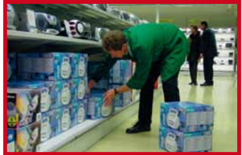
Langdurig aanhouden van een belastende houding