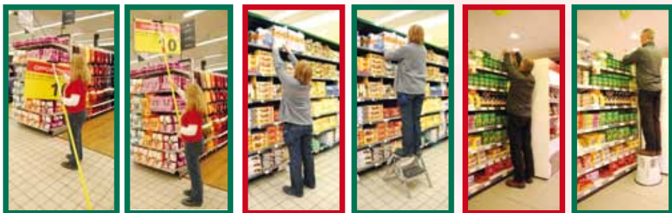
Met een verlengstuk kunnen promo-affiches makkelijk opgehangen worden