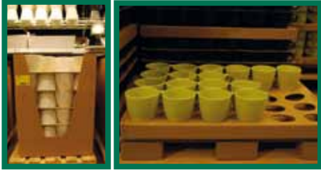
Het gebruik van palletten met kant-en-klare koopwaren beperkt de manuele behandeling