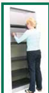
Dit is de gepaste hoogte om lichtere, vaak gebruikte voorwerpen in op te bergen