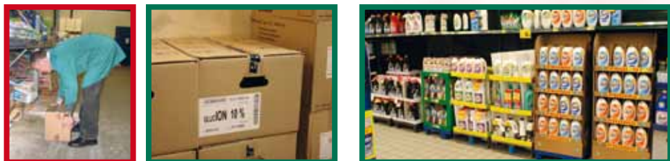
Het tillen en verplaatsen van lasten wordt vergemakkelijkt als ze goed kunnen vastgenomen worden bijvoorbeeld door handgrepen