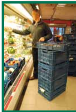
Plaats de kratten die je moet verwerken hoger. Dat vermijdt bukken en buigen.