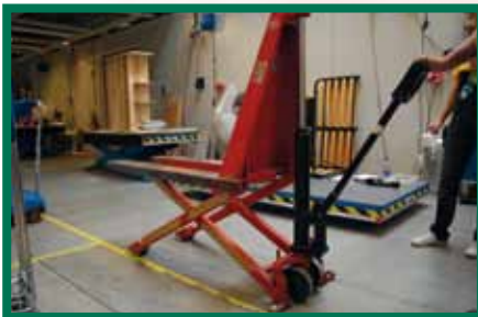
Gemechaniseerde aanpassing van de hoogte van het werkvlak