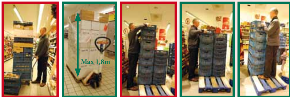
Palletten niet te hoog stapelen; niet meer dan 1,8 m (bij voorkeur 1,6m)