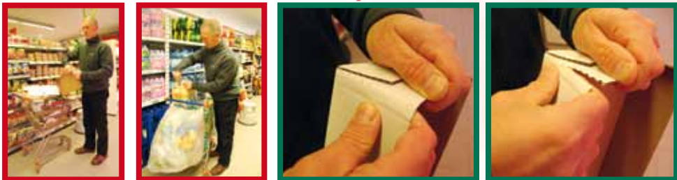
Het scheuren van kartonnen of plasticen verpakkingen wordt vergemakkelijkt door voorgeplooide insnijdingen