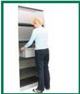
Dit is de gepaste hoogte om zware lasten in een rek op te bergen