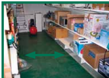
Een ordelijke werkplek beperkt het risico op valpartijen en verbetert de toegankelijkheid