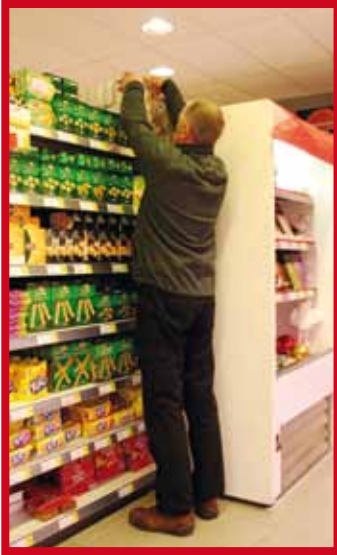
Herhaald uitvoeren van belastende bewegingen voor schouders en armen

Hieronder ziet u enkele voorbeelden van situaties die een fysiek risico inhouden voor de winkelbedienden-aanvullers: