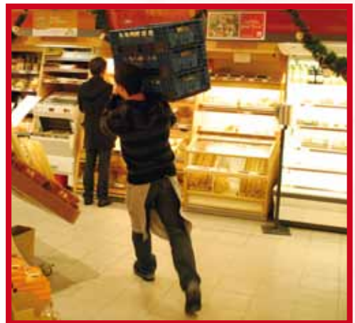
Inspanning met een belastende houding voor de rug en de armen