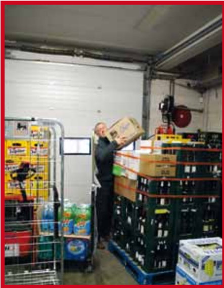
Door plaatsgebrek worden belastende houdingen voor de rug aangenomen